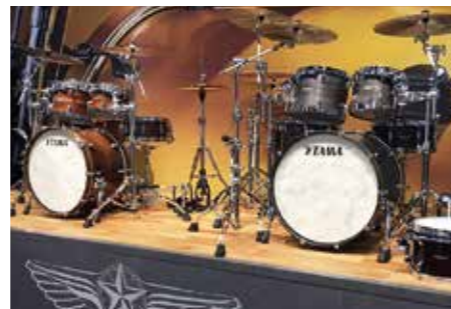
ショウブースの展示